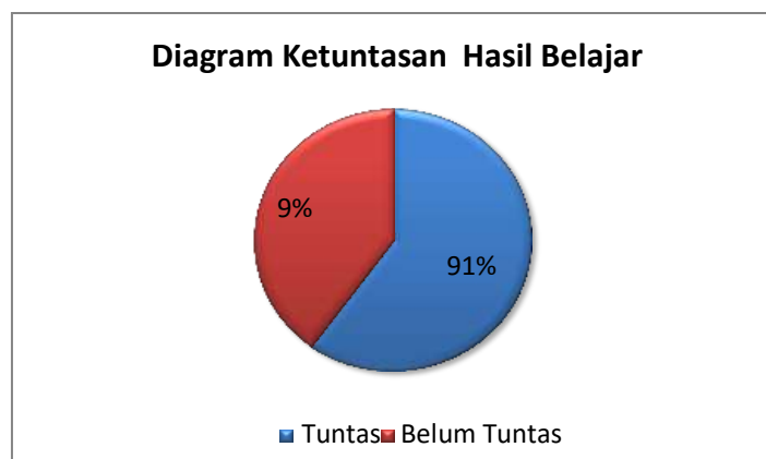
Gambar 2. Presentase Ketuntasan Hasil Belajar Siklus 2

Persentase ketuntasan dapat digambarkan dalam bentuk grafik diagram pie berikut ini: