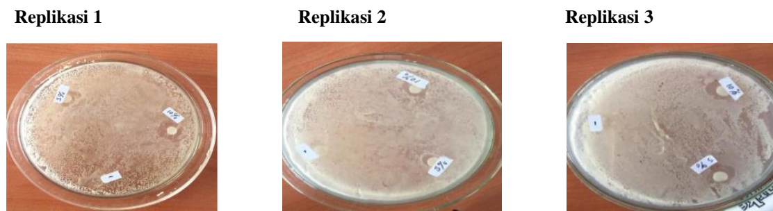
Gambar 2. Hasil penelitian zona hambat