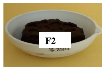
Gambar 1. Sabun padat ekstrak kulit pisang ambon

Pisang merupakan komoditi pasar Indonesia yang cukup tinggi produksinya. Kulit buah pisang matang merupakan limbah dari olahan buah pisang matang seperti dalam pembuatan berbagai jenis kue dari daging buah pisang (Maitimu, Wakano, & Sahertian, 2020). Pemanfaatan pisang hanya terbatas pada buahnya saja sedangkan pada bagian kulit buahnya masih menjadi bahan tidak terpakai atau limbah. Padahal kulit pisang, termasuk kulit pisang ambon memiliki kandungan senyawa kimia fenol yang cukup tinggi (Ramdani, Hernaman, Nurmeidiansyah, & Heryadi, 2016).