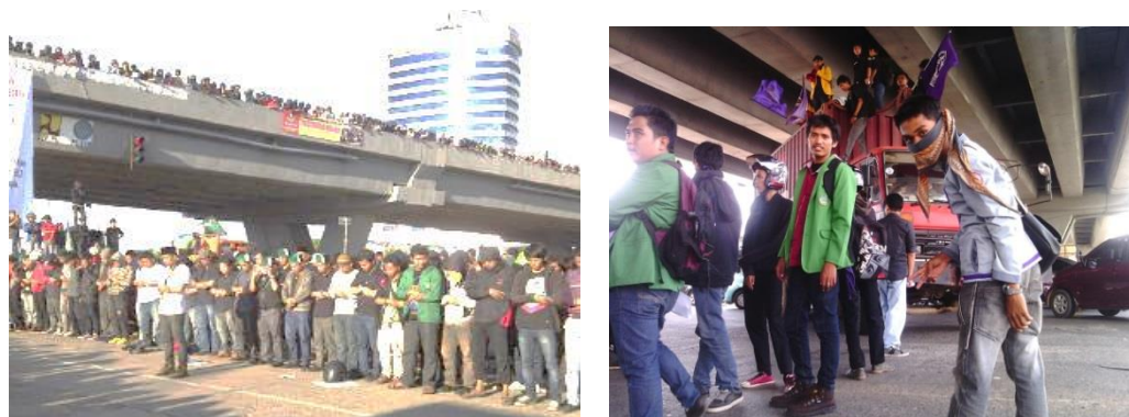
Gambar. 5: Demonstrasi. Salah Satu Aktivitas yang Sering Terjadi di Fly-Over Urip Sumoharjo yang Dilakukan oleh Aktivis Mahasiswa. Sumber : Hasil Observasi, Tahun 2015

Dari hasil wawancara dengan pedagang ini, omset mereka juga meningkat dengan berdagang di area ini dibandingkan di tempat lain. Yang biasanya hanya mendapatkan pemasukan Rp. 20.000 - Rp. 30.000 tiap harinya, di tempat ini mereka mendapatkan rata-rata Rp. 30.000 - Rp. 35.000 tiap harinya. Jalan merupakan ruang ekonomi dan politik suatu kota dimana menjadi tempat penduduk berkumpul dan bertukar informasi. Allan B. Jacobs (1985) dalam (Heryanto 2011) menyatakan jalan adalah untuk kegiatan ekonomi dimana masyarakat pedagang menggelar dagangannya, karena sifatnya yang menarik orang yang berlalulalang. Jalan adalah tempat dimana pemerintah mengawasi konflik antara kebijakan yang dikeluarkan dan pendapat dari masyarakat.