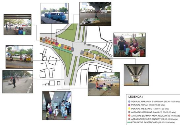
Gambar. 3: Pola Penyebaran Aktivitas di Kolong Fly-Over. Ruang di Kolong Fly-Over Merupakan Wadah untuk Berbagai Aktivitas.