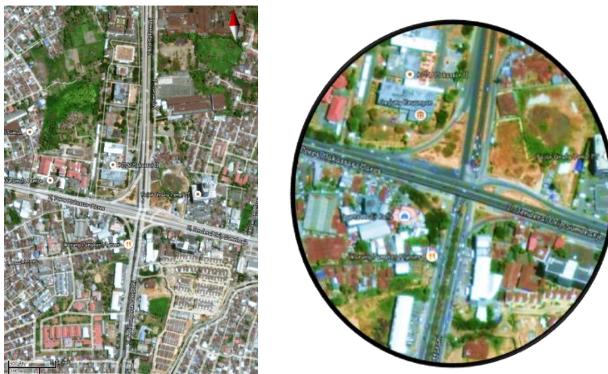
Gambar. 1: Fly-Over Jendral Urip Sumoharjo KM 4 Makassar

dari jalan layang ( Fly-Over ) Urip Sumoharjo. Waktu penelitian dilaksanakan mulai dari bulan Maret hingga bulan Agustus 2015.