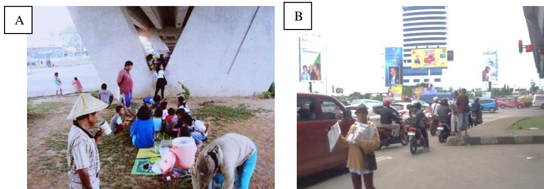
Gambar. 6: Pedagang Makanan dan Pengamen Jalanan Mulai Mengisi Kolong Fly-Over pada Pagi Hari (A), Penjual Koran Memulai Aktivitas Mereka pada Pagi Hari Dengan Memencar ke Jalan Sekitar Dekat Lampu Merah (B).

Aktivitas para pedagang ini diikuti oleh kemunculan aktivitas serupa seperti penjual koran dan pedagang mie bakso gerobak yang juga mengambil tempat di area ini. Selain itu, dengan adanya aktivitas dari pedagang yang membuat warung kopi dadakan di bawah kolong Fly-Over mengundang aktivitas dari supir angkutan kota untuk singgah pada siang hari dengan tujuan untuk menikmati kopi, makan ataupun istirahat siang.