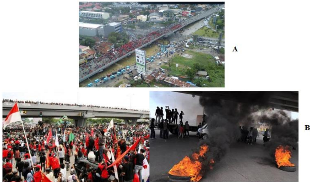
Gambar. 2: Aktivitas Demonstrasi Dimana Mahasiswa sebagai Aktor Mendefinisikan Ruang Sebagai Tempat Demonstrasi; (A) Proses Terbentuknya Aktivitas, (B) Suasana Demonstrasi di Fly-Over Urip Sumoharjo .

Hasil penelitian ini mengungkapkan yang menjadi kekuatan pembentuk aktivitas di Fly-Over Urip Sumoharjo adalah karena adanya kesatuan aktor-ruang-waktu. Posisi aktor adalah sebagai unsur yang berperan utama dalam memaknai ruang ( space ) menjadi sebuah tempat ( place ) (Gambar 2), juga merupakan unsur yang menentukan dalam pembentukan sebuah peristiwa. Ruang sebagai unsur yang mewadahi berlangsungnya sebuah kegiatan atau peristiwa (Gambar 3), sedangkan waktu adalah unsur yang “seolah-olah” mengatur, mengendalikan dan menentukan kapan peristiwa itu terjadi dan kapan peristiwa itu berhenti (Gambar 4). Ketiga unsur aktor-ruang-waktu dalam sebuah peristiwa senantiasa bergerak, berubah, bergeser, berganti dan selalu menjadi satu kesatuan yang utuh. Ruang bisa berwujud fisik dengan sifat yang tetap namun aktor dapat memaknai ruang menjadi sesuatu yang lain, dapat mengubah bentuk dengan menambahkan sesuatu yang lain sehingga dapat mewujud dalam skala yang tidak terbatas. Dalam konteks waktu, ruang juga dapat meng-ada dan lenyap dengan sangat leluasa.