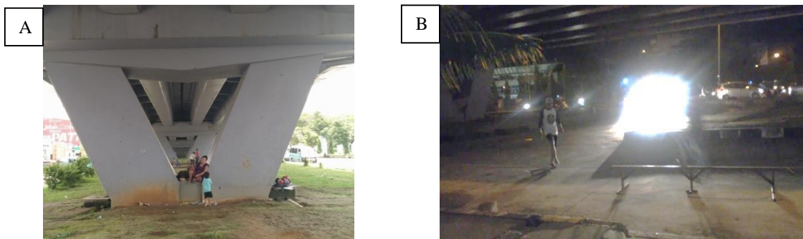
Gambar. 6. Aktivitas dari Tunawisma yang Menggunakan Ruang di Tengah Kolom Berbentuk "V" Sebagai Ruang Tidur Mereka (A). Aktivitas Komunitas Skateboard yang Terjadi pada Sore Hari di Kolong Fly-Over (B)