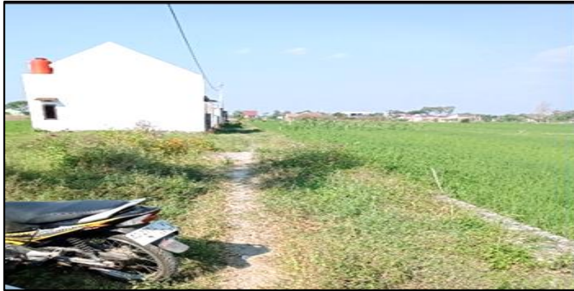
Gambar 2. Kondisi Jalan Scattered Settlement

Semakin jauh dari keramaian, penghuni akan merasa membutuhkan aksesibilitas (Burke, 2015). Hal ini terbukti pada scattered settlement bahwa aksesibilitas ke pusat keramaian dan perbaikan kondisi jalan merupakan kebutuhan yang dirasa perlu di tiap perumahan. Hal ini ditunjukkan dengan hasil kuesioner bahwa mayoritas dari penghuni merasa jauh terhadap fasilitas kesehatan dan ekonomi. Mereka mengeluhkan akses dan kondisi jalan yang kurang baik dan kurang lebar untuk menuju dan di dalam permukiman mereka. Jalan di permukiman mereka belum beraspal, masih berbatuan, dan sempit. Berikut adalah gambar kondisi jalan scattered settlement .