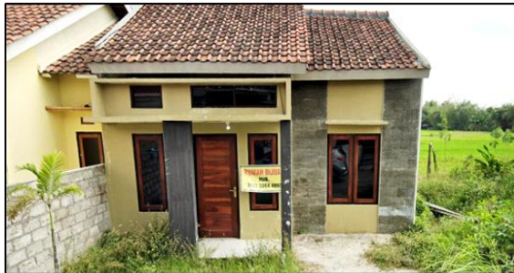
Gambar 4. Bangunan Rumah Scattered Settlement

kurang baik sehingga harus diperbaiki berupa plafon, dinding, atap, sering berjamur yang disebabkan kondisi dekat sawah adalah lembab. Plafon juga rawan roboh. Hal ini menunjukkan penghuni sebenarnya membutuhkan kualitas bangunan yang lebih baik walaupun harga rumah mereka cukup terjangkau. Berikut adalah gambar 4 terkait kondisi rumah scattered settlement .