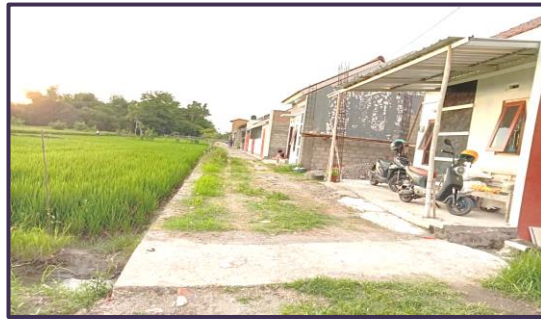
Gambar 3. Kondisi Scattered Settlement tanpa Fasilitas Keamanan