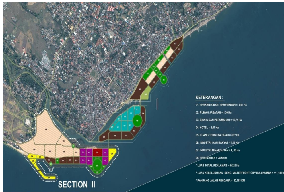
Gambar 2. Rencana Penggunaan Lahan Waterfrontcity Bulukumba