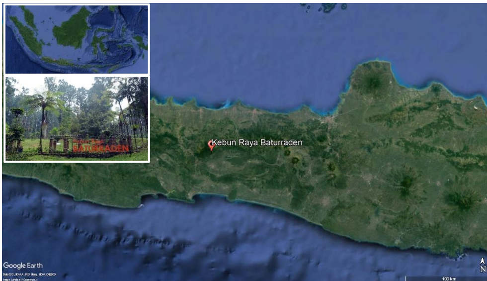
Gambar 1. Lokasi penelitian di Kebun Raya Baturraden

Metode penelitian yang digunakan yaitu dengan metode purposive dengan melakukan inventarisasi semua koleksi palem berdasarkan buku katalog KR Baturraden (Irawan et al. , 2015) dan dilakukan informasi koleksi palem tersebut. Studi literatur juga dilakukan untuk mengetahui informasi ekologis dan kegunaannya dari koleksi palem-palem KR Baturraden. Analisis penelitian menggunakan metode deskriptif dengan menjelaskan secara mendetail koleksi palem yang berada di Kebun Raya Baturraden. Data yang diambil yaitu antara lain informasi jenis, jumlah spesimen, dan foto koleksi didokumentasikan.