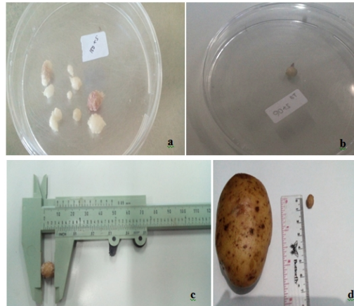
Gambar 1. (a) Jumlah umbi pada perlakuan gula 150 g/L, (b) jumlah umbi pada perlakuan gula 90 g/L, (c) diameter umbi dengan jangka sorong, dan (d) perbandingan ukuran umbi mikro dengan umbi biasa

vitro . Umumnya umbi terbentuk akibat kebutuhan energi yang bersumber dari sukrosa yang telah melampaui laju fotosintesis, sehingga kelebihan sukrosa akan merangsang sintesis amilum dan membentuk umbi mikro.